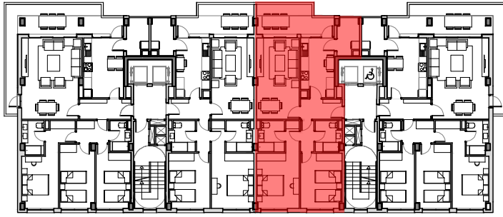
PLANTAS 1º A 7º