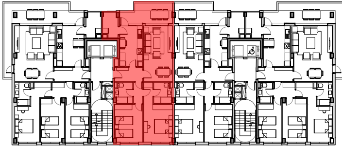
PLANTAS 1º A 7º