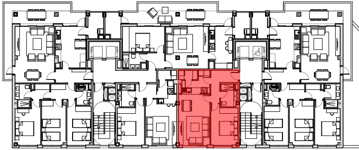
PLANTAS 8º A 9º