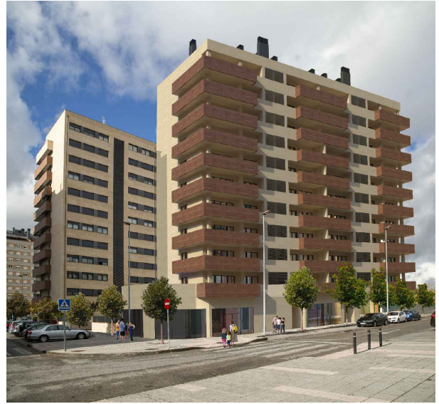
PORTAL 11 Viv. 1D14