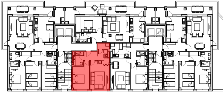
PLANTAS 8º A 9º